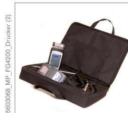
Messpaket Dräger FG4200